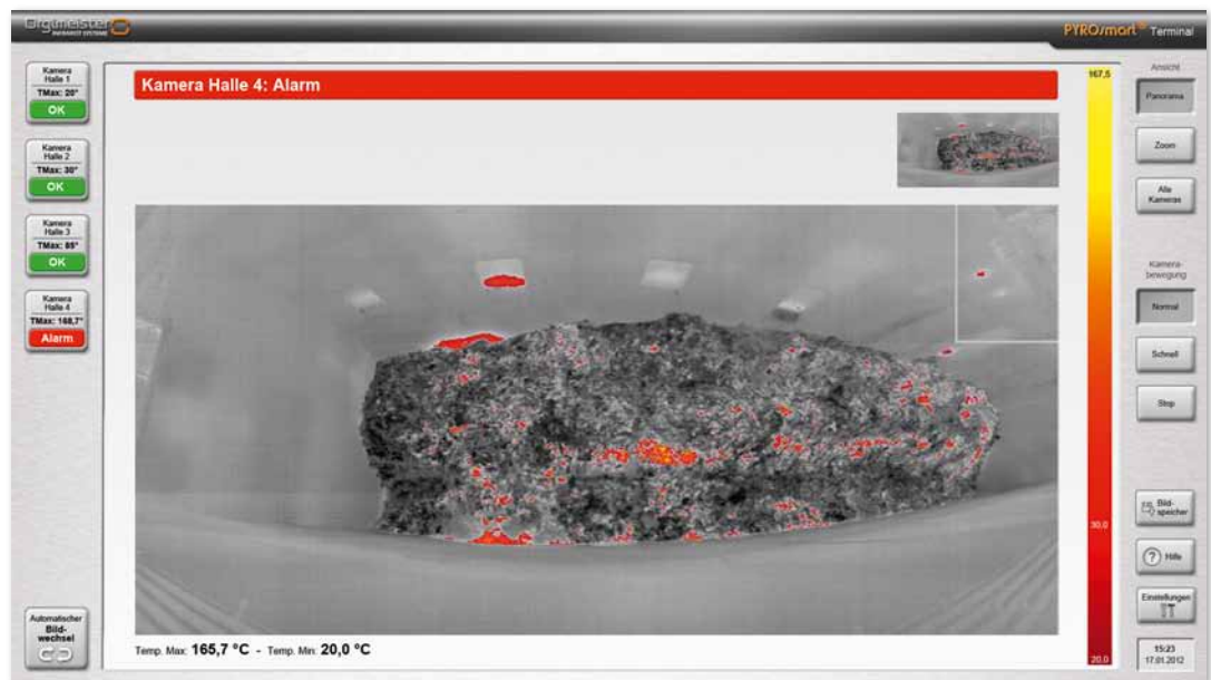
IR-Panoramadarstellung eines Müllbunkers und TouchScreen Bedienmenü