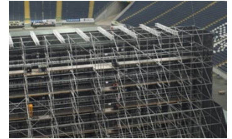
Die LED-Videowand: Sie ist auf einem 40 Tonnen schweren Stahlgerüst montiert und besteht aus 336 Modulen