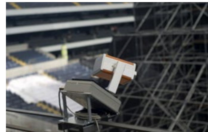
Erfassen von großen Detektionsbereichen: Das PYROsmart-System scannt laufend die gesamte Rückseite der 412 m 2 großen Videowand ab