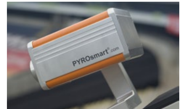
Integriert in spezielle Gehäuse: Das System arbeitet mit einer Infrarot- und einer Wärmebildkamera und ist mit einem Schwenk-Neigeantrieb ausgestattet

kann auch erst dann ansprechen, wenn ein Brand schon entstanden ist. Außerdem würde eine Sprinkleranlage immer die gesamte Videowand löschen und damit einen großen Schaden verursachen. Das Facility Management entschied sich aufgrund dieser Fakten für das Brandfrüherkennungssystem PYROsmart der Firma ORGLMEISTER Infrarot-Systeme. Das PYROsmart-System arbeitet mit einer Infrarot-Wärmebild- und einer Videokamera, die zusammen in einem speziellen Gehäuse integriert sind. Die Kameraeinheit, die mit einem hochpräzisen Schwenk-Neigeantrieb ausgestattet ist, ermöglicht ein systematisches Erfassen von großen Detektionsbereichen. Dieses System ist auf der Tribüne installiert und erfasst von dort die gesamte Rückseite der Videowand. Die hochempfindliche Wärmebildkamera scannt permanent alle LED-Module und kann dabei Temperatur-Auffälligkeiten in Echtzeit erfassen. Zu dem System gehört auch ein PC mit einer patentierten Software, die alle aufgenommenen Bilder zu einem detailgetreuen Panoramabild zusammensetzt.