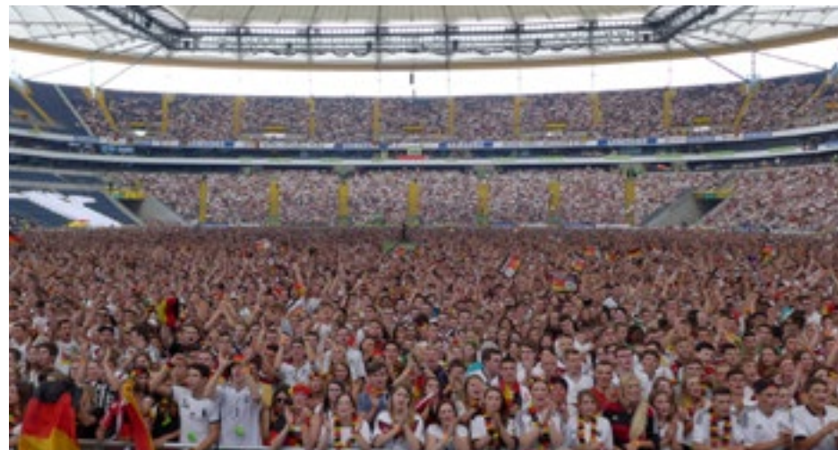
Jubel beim WM-Endspiel: Die Zuschauer befinden sich in unmittelbarer Nähe zur Videoleinwand. Der Brandschutz für die Leinwand gehört zum Sicherheitskonzept in der Arena